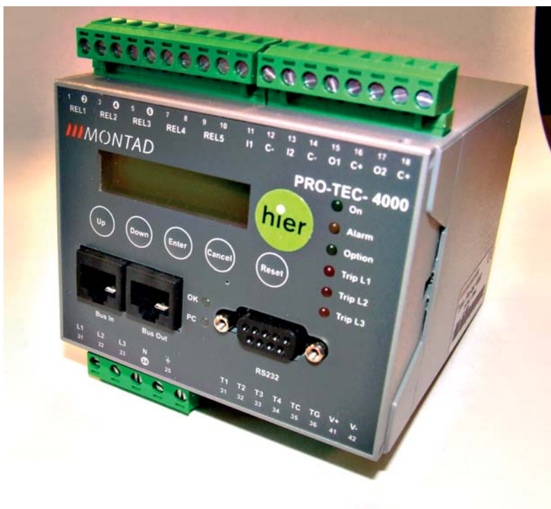
Hart van het kabelbeveiligingssysteem van Montad, de regelunit Pro-Tec 4000.

Verbeterde openbare verlichting in Oosterhout. Hier is gekozen voor een duidelijker straatbeeld en licht waarbij nog kleuren kunnen worden herkend.